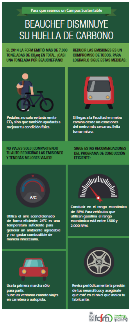
Ilustración 1: Pendón campaña grafica

Estas campañas consisten en la instalación de pendones en los distintos edificios dentro del campus, con infografía sobre acciones que pueden ser realizadas por toda la comunidad para ayudar a reducir las emisiones de CO 2 (ver Ilustración 1) y uso eficiente de la energía.