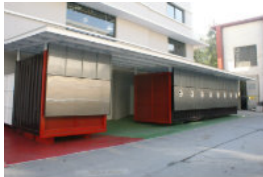
Imagen 1: centro de acopio ReBeauchef

Además de los residuos no peligrosos, el plan integral de gestión de residuos contempla la separación, acopio y retiro de residuos peligrosos generados en la Facultad, para lo cual se implementará un centro de acopio con todos los estándares de seguridad necesarios (ver la Imagen 3). Esta medida de mitigación tiene como objetivo impactar a las emisiones de CO 2 e asociadas al Alcance 3. Para mayor información referirse al Plan Integral de Gestión de Residuos.