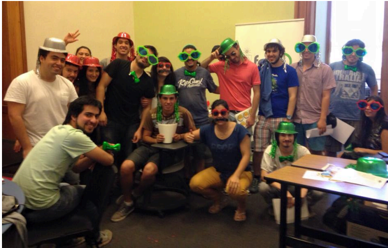
Imagen 2: Equipo de practicantes previo al inicio del carnaval de difusión de la campaña ¿por qué es importante?

En Imagen 2 se muestra una foto del equipo de practicantes de la oficina que difundieron el folleto y pegatinas en el mes de Diciembre del 2014. En Imagen 3 se expone el apoyo grafico utilizado (pegatinas).