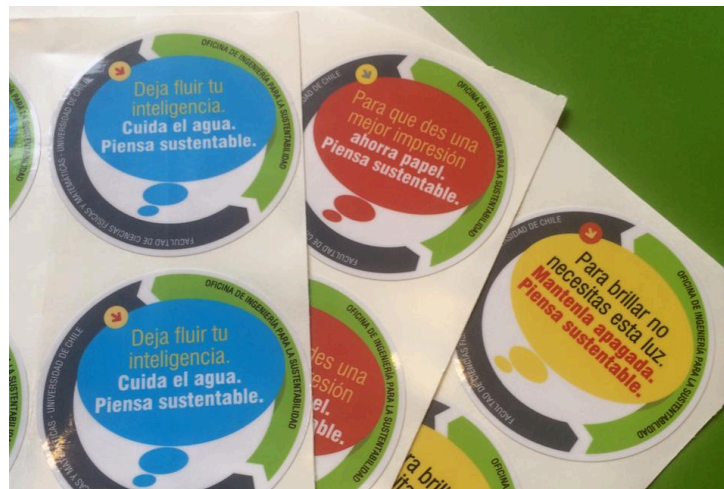
Imagen 3: Pegatinas diseñadas por Pura Comunicación

La campaña tuvo un costo de $350.000 y su objetivo fue impactar en las emisiones asociadas a los alcances 2 y 3. Se pretende extender la campaña a todos los edificios de la facultad.